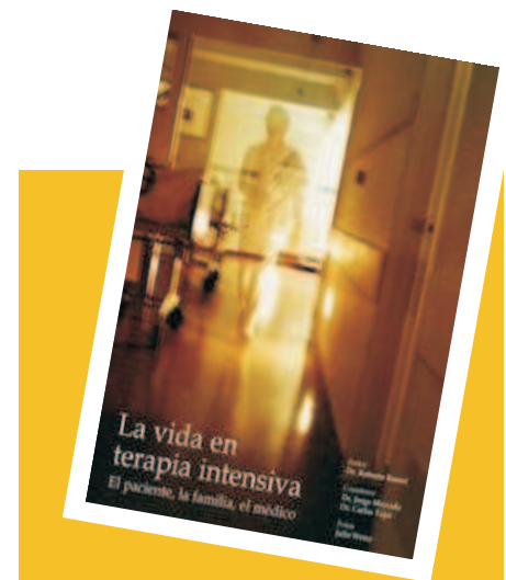
LA VIDA EN TERAPIA INTENSIVA El Paciente, la Familia, el Médico Reussi/Mercado/Tajer

74612 Navarro Rubio: ENCUESTAS DE SALUD, 1994, 128 págs., $ 14.280.- 20938 Nilo Hernández: MEDICINA DEL DEPORTE, 1997, 492 págs., $ 40.460.- 22240 Ninemeier: PRINCIPIOS DE SUPERVISIÓN. ESTRATEGIAS DE LIDERAZGO PARA CENTROS DE SALUD, 2000, 316 págs., $ 27.846.- 95558 O.M.S.: CLASIFICACIÓN INTERNACIONAL DE ENFERMEDADES (9ª REVISIÓN) MODIFICACIÓN CLÍNICA (CIE-9-MC), 1999, 1.952 págs., $ 219.912.- 22419 Ochoa-Lucio-Vallejo-Díaz-Ruale: ECONOMÍA DE LA SALUD. MANUAL PRÁCTICO PARA LA GESTIÓN LOCAL DE LA SALUD, 1999, 374 págs., $ 28.560.- 78535 Olazabal-García: MENOPAUSIA: UNA VISIÓN INTEGRAL DESDE LA ATENCIÓN PRIMARIA, 1994, 190 págs., $ 15.470.- 33471 Olive Pérez: DICCIONARIO DE ASMA, 1992, 100 págs., $ 23.086.- 33476 Olive Pérez-Granel Tena: DICCIONARIO DE ALERGIAS E INMUNOLOGÍA, 1991, 170 págs., $ 17.612.- 73442 Paez: DICCIONARIO DE FARMACOS, 1998, 328 págs., $ 23.086.- 87312 Paez-San Juan-Romo-Vergara: SIDA: IMAGEN Y PREVENCIÓN, 1991, 344 págs., $ 16.422.-