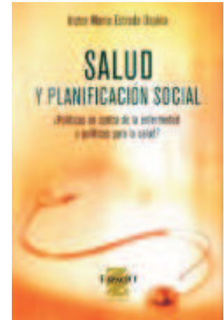
SALUD Y PLANIFICACION SOCIAL Políticas en Contra de la Enfermedad o Políticas para Salud Victor M. Estrada Ospina

27925 Gavidia Catalan: SALUD, EDUCACION Y CALIDAD DE VIDA. DE COMO LAS CONCEPCIONES DEL PROFESORADO INCIDEN SALUD, 1998, 132 págs., _____ $ 14.042.- 95528 Genetet-Robiquet-Fernandez: GLOSARIO DE LA TRANSFUSION SANGUINEA, 1990, 140 págs., _____ $ 54.978.- 81657 Giacomantone-Mejia: ESTRES PREOPERATORIO Y RIESGO QUIRURGICO. EL IMPACTO EMOCIONAL DE LA CIRUGIA, 1997, 240 págs., _____ $ 24.752.-