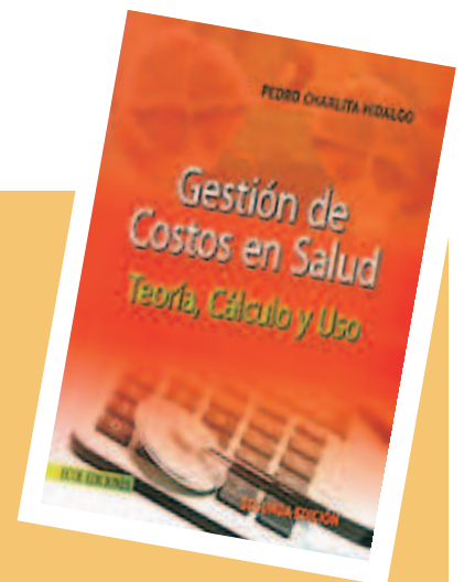
GESTION DE COSTOS EN SALUD Teoría, Cálculo y Uso Pedro Charlita Hidalgo

La obra permite establecer la vinculación entre contabilidad y gerencia, familiarizar al lector con aspectos básicos de costos tales como su clasificación, comportamiento y contabilización; describir los atributos que caracterizan al hospital como una organización compleja, exponer una metodología para calcular costos de salud, mostrar cómo hacer operativas las estrategias de las organizaciones, dar a conocer el efecto del volumen de servicios prestados en utilidad, subrayar la importancia del manejo de los costos para la toma de decisiones gerenciales, valorar la relevancia de la calidad y sus costos en la prestación de los servicios.